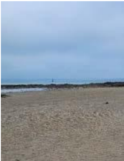
Anse de Toullain Le Poulig