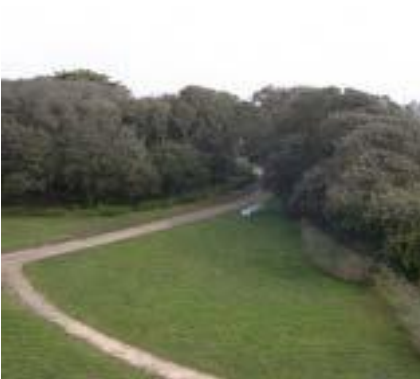
Parc de Pen Avel Le Croisic