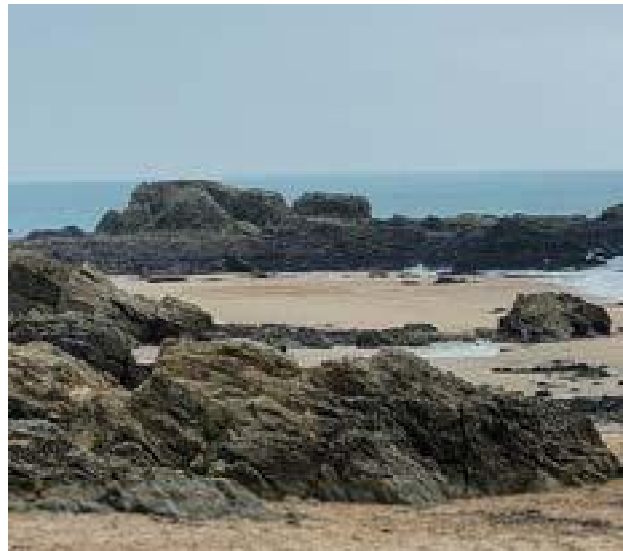
Plage de la Govelie Batz sur Mer