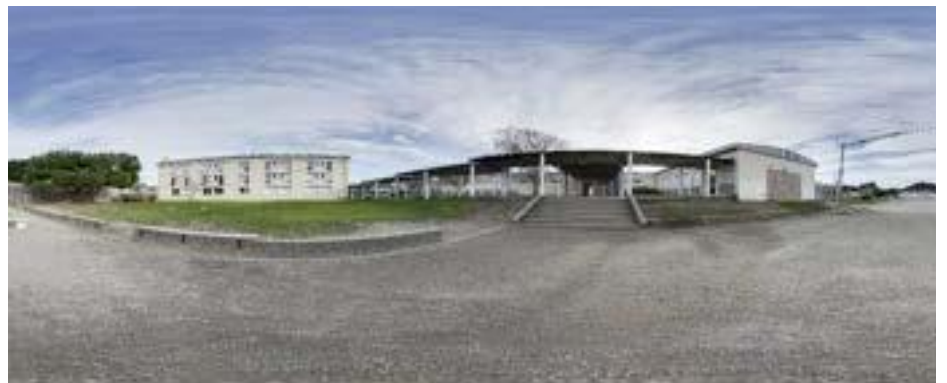
Gymnase du collège Jules Verne Le Pouliguen