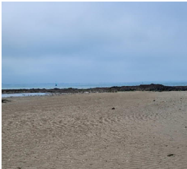
Anse de Toullain Le Pouliguen