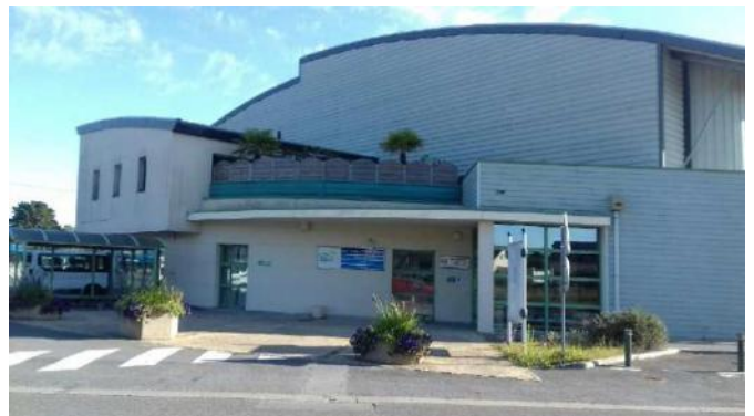
Gymnase de la Salle de l'Atlantique Le Pouliguen