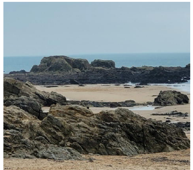
Plage de la Gouvelle Batz sur Mer