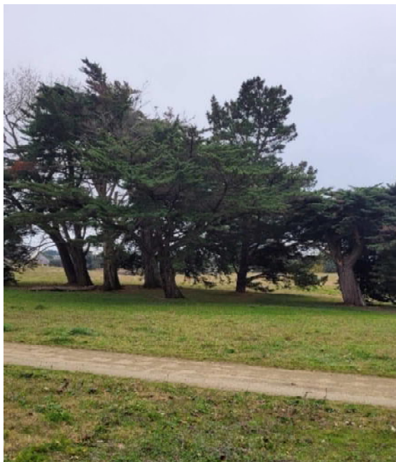
Espace de Codan Le Pouliguen